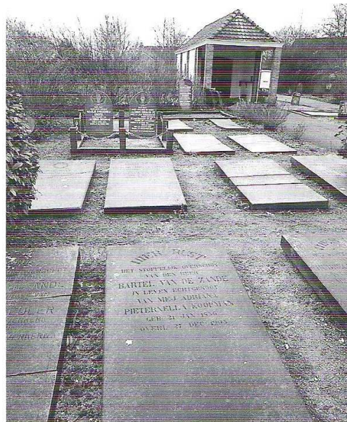
De oude begraafplaats van Nieuwerkerk

Vroeger werd er vanwege de armoede nog veel in algemene graven begraven, vertelt Flikweert. “Deze vakken zijn tot nu toe nog steeds niet geruimd. Voor de gemeentelijke herindeling in 1997 en de reorganisatie werden de gewone koopgraven nog uitgegeven voor onbepaalde tijd. Voor de watersnoodramp werd er al helemaal niets geruimd. De onlangs opgestelde beleidsnota geeft echter aan dat er in de toekomst bij plaatsgebrek geruimd moet worden. Ik heb dat nog nooit meegemaakt en het zal wel wat rumoer geven bij de nabestaanden, maar de politiek beslist. Voorlopig is er op de meeste begraafplaatsen nog genoeg ruimte.”